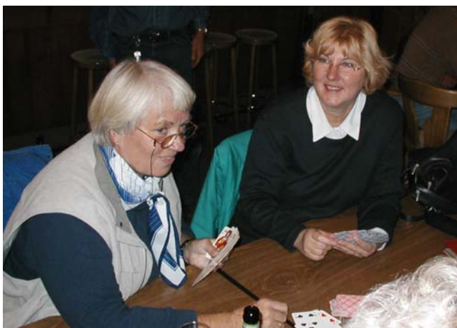
18, 20, nur nicht passen.... Diese Damen nutzten den Seglerhock zum Kartenkloppen