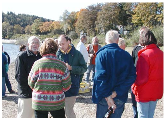
Gemütlicher Frühschoppen in Enkhausen... weitere Bilder in Kürze auf unserer Homepage oder hier: http://www.molitorfj.de/1%20Private%20Homepage/Mein_Segelclub.htm