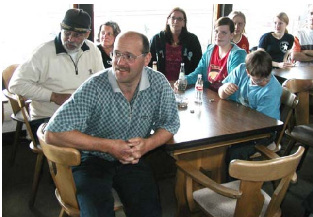
Gespannte Zuschauer bei der Siegerehrung