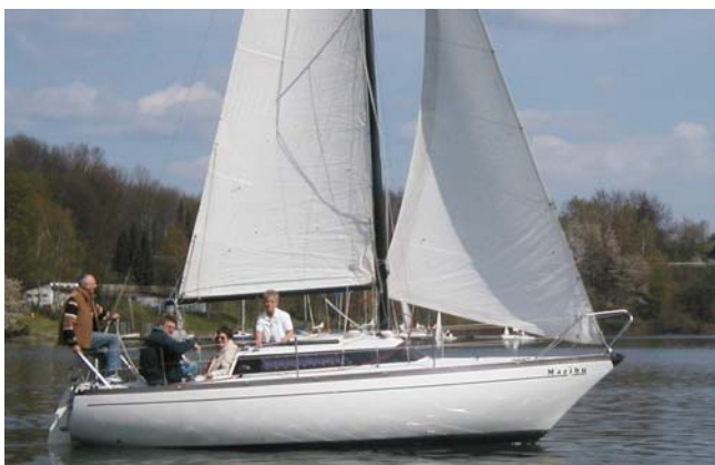
Hier scheinen etliche Fässer Bier in der Backskiste zu liegen, der Bug steigt weit aus dem Wasser.