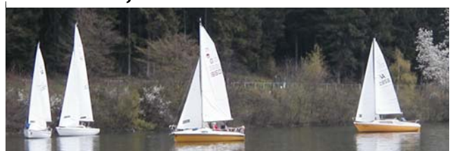
Während der Geschwaderfahrt im „Schlauch“.