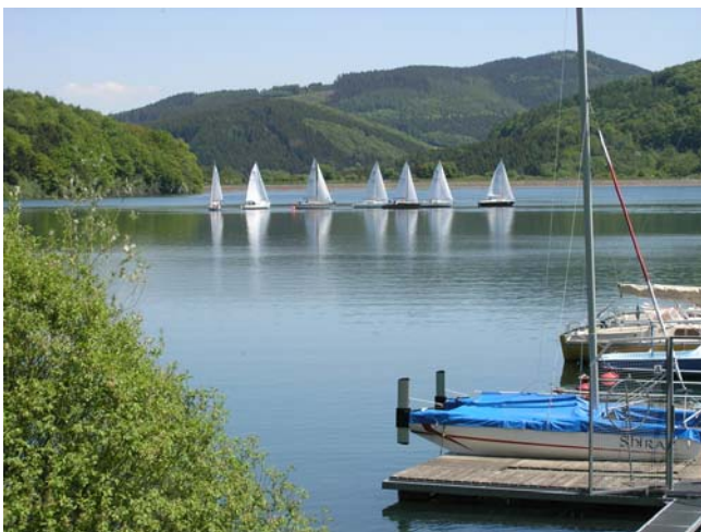
Wie an der Perlenschnur gezogen!