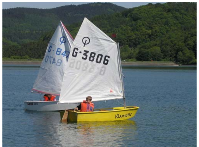
Zwei Optis im Finish!