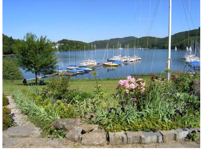
Unser Clubgelände präsentierte sich wieder in Hochform!